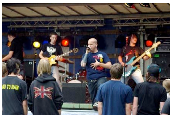
Gaellus Open Air