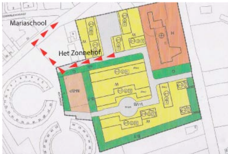
Bouwplan Kloostertuin met de nieuw geplande ontsluitingsweg

Er zijn o.m. plannen voor de bouw van een vijftal woningen in en rond de witte boerderijhoeve achter de kerk aan de Burgemeester van de Berghlaan en twee woningen op de plaats van de oude parochiezaal aan de Bernadettelaan. In 2009 wordt er op verschillende plaatsen in Tienray in de vrije sector gebouwd en zijn er nog enkele kavels beschikbaar om te bouwen. Wanneer de fusie van voetbalverenigingen Top '27 en Swolgense Boys een feit is, zou ook de locatie van het huidige voetbalcomplex aan de Nehobolaan gebruikt kunnen worden voor woningbouw.