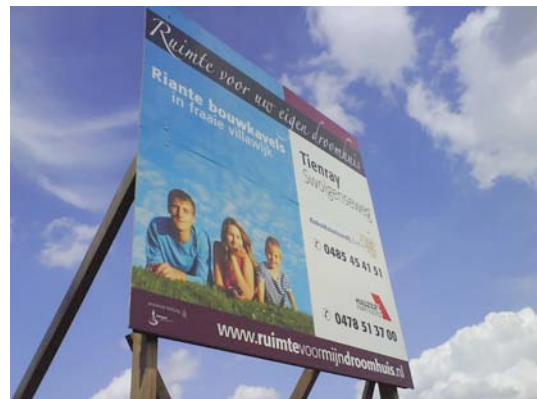
Er kan volop gebouwd worden in Tienray