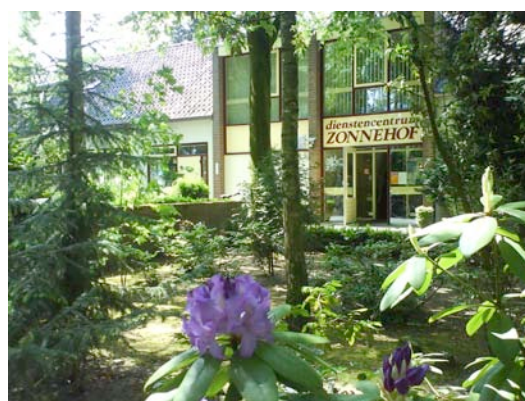
Parochiehuis en Dienstencentrum Zonnehof

Het Parochiehuis biedt nu al onderdak aan onder andere de muziekvereniging, toneelclub, majorettevereniging, de vrouwenbeweging, de carnavalsvereniging en het gemengd koor. Ook wordt er bijna iedere zondag gekieënd. De opbrengst van dit kien is voor veel verenigingen nog steeds een van de voornaamste inkomstenbronnen. Het aantal mensen dat kient neemt echter steeds verder af waardoor deze inkomstenbron voor verenigingen en het Parochiehuis onzeker wordt. Bovendien heeft het stichtingsbestuur een claim bij de gemeente neergelegd.