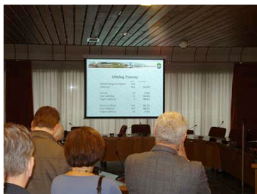
Dorpspeiling herindeling, gezamenlijk georganiseerd door de dorpsraden in de gemeente Meerlo-Wanssum.

Dit betekent niet dat rond het bestuurlijke klimaat tussen dorpsraad en gemeente geen problemen meer zijn. Er is nog altijd geen goed beeld van de werking van de ambtelijke organisatie en andersom zal het voor de gemeenteambtenaar niet altijd duidelijk zijn wat er allemaal in het dorp speelt en hoe hun handelingen ontvangen worden.