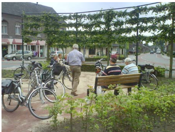
Ontmoetingsplekken dorpskern Tienray

Als dorp met een eigen identiteit wordt Tienray aantrekkelijker voor de toerist. De grijze uitstraling (vanwege de n554 dwars door Tienray) mag veranderen in een gezellige omgeving met voldoende groen en rustplekken.