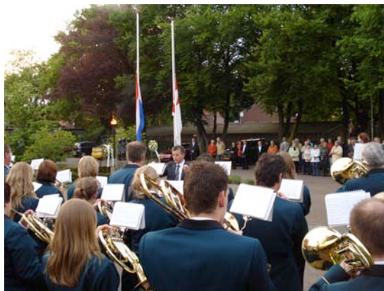
4 Mei herdenking op Hanna v.d. Voortplein