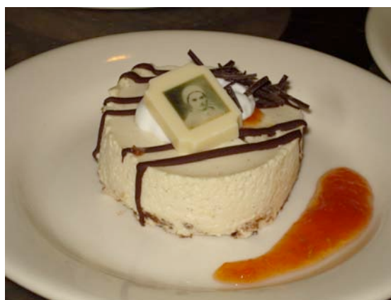
Tienders gebak, de Bernadette

Het bezoek van vele pelgrims en het feit dat ons dorp aan een knooppunt van fietsroutes ligt, maakt het voor de commerciële horeca wellicht interessant in Tienray te investeren. Hier liggen financiële mogelijkheden die ons helpen oude gebouwen te restaureren en onze kerk met de prachtige Lourdesgrot een toekomst te geven.