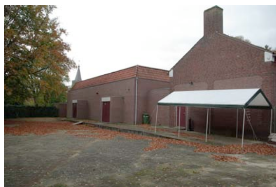
Het terrein achter het parochiehuis zou meer open karakter mogen krijgen

Het aangrenzende grasveld is sinds een paar jaar een kermis- en evenemententerrein. We missen hier echter voorzieningen zoals stroom en wateraansluitingen die bij een evenement nodig zijn. Wanneer de eerder genoemde omheiningen verdwijnen en er een nieuwe terreinindeling gemaakt wordt, komt er ook genoeg ruimte voor alle kermisattracties. Het zal duidelijk zijn dat het betegelde terrein en de aangrenzende groenstrook na enkele aanpassingen een veel mooier aanzicht en tal van gebruiksmogelijkheden kunnen krijgen.