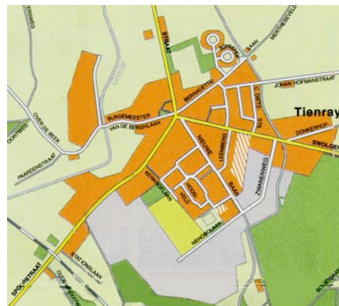
Drukke op de Swolgenseweg / Tienray rondom een knooppunt van (verbindings)wegen.