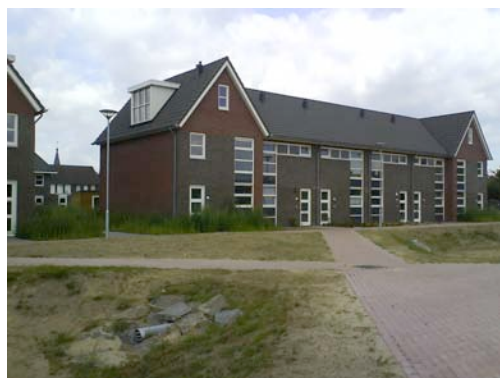
Bouwproject Zwanenberg met op de voorgrond het hemelwateringsgebied

De dorpsraad Tienray heeft eind 2006 de gemeente Meerlo-Wanssum laten weten dat zij in dit gebied de 'historie van het steenfabriekverleden' verbeeld en verwerkt zou willen zien. De werkgroep Tiensteen heeft drie ontwerpconcepten ontwikkeld waarbij het bestaan van de steenfabriek in herinnering wordt gebracht met kunst in de openbare ruimte. In het bouwplan is, centraal gelegen, een hemelwaterbergingsgebied (wadi) van ongeveer 17x80 meter gesitueerd dat als drager voor een kunsttoepassing zou kunnen dienen. De gemeente wil hier graag 'een ruimtelijke omgeving creëren van hoge kwaliteit'.