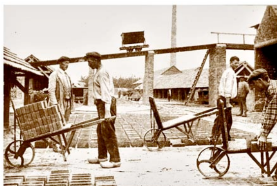
Arbeiders aan het werk op één van de voormalige steenfabrieken die Tienray rijk was

De drie ontwerpconcepten gaan in op de rijke pelgrimsgeschiedenis van Tienray als Klein Lourdes, de Kruiswegstaties, de wereld van de wandelaar en de toekomstige nieuwe inwoners. In het concept Steenwegstaties wordt de verlichting van de openbare ruimte aan de Trambaan geïntegreerd met lichtbeelden uit het verleden, ten tijde van het bestaan van de steenfabriek op de nieuwbouwlocatie, in gemetseld straatmeubilair. De groene ruimte wordt een openbare ruimte met een functie van wadi. Een oversteek met gemetselde trappen zal het groene gebied ontsluiten waardoor een open karakter gehandhaafd blijft.