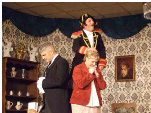
Voorstelling toneelvereniging Mimus

Vooraf ook liggen er mogelijkheden in het benutten en uitbreiden van bestaande activiteiten. Een nieuw initiatief als Gaellus Open Air is een gratis toegankelijk kleinschalig muziekfestival, georganiseerd vanuit het jongerencentrum, dat een breed publiek wil aanspreken. Dit evenement kan op sympathie van het dorp rekenen en biedt wellicht ook kansen als podium voor een breder cultureel palet.